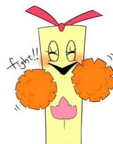
図書館キャラクター しおりちゃん